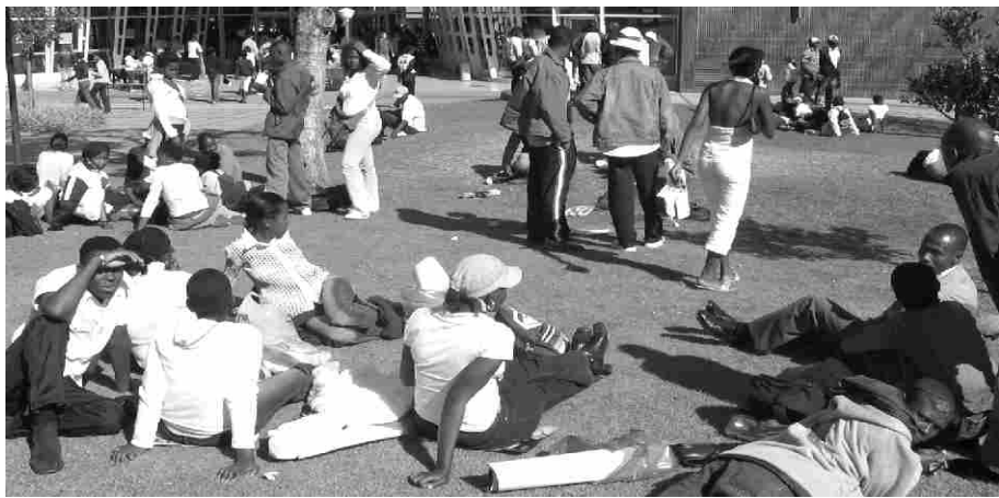
Voornemende studente met opedag voor die GW. Afrikaanse studente voel hul griewe, soos dat UP bestuur massas swart studente vir opedag met busse aangery het, en niks doen om Afrikaanse studente te werf nie, word geïgnoreer.